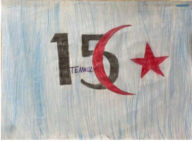
Gülümser Çimen 4/C