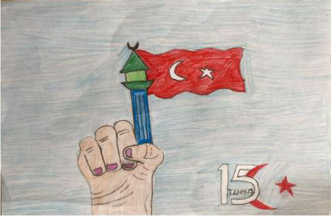
Ahsen Nurbanu Eryiğit 4/C