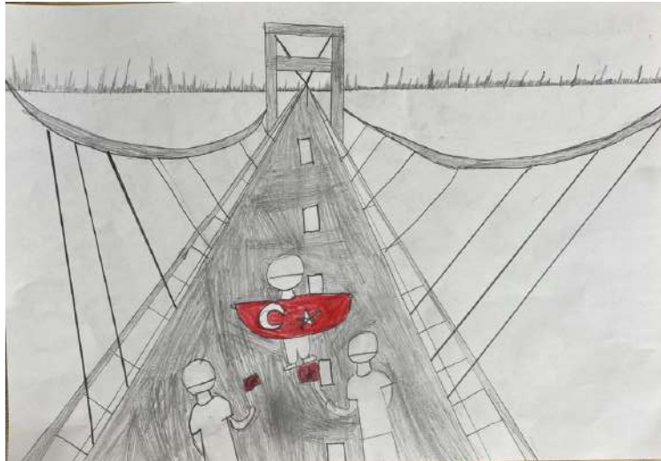
Melis Zeynep Günaydın 4/D