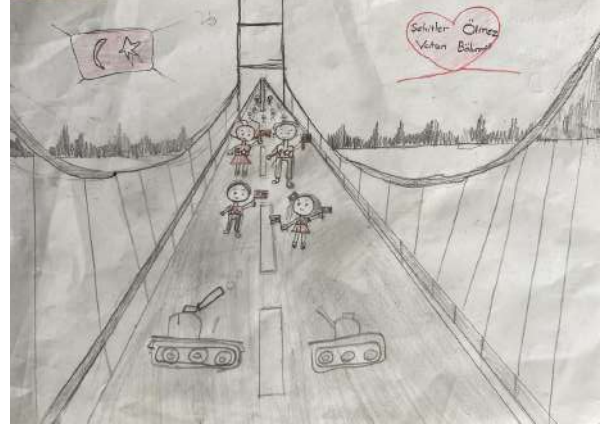
Nisanur Erdoğan 4/D